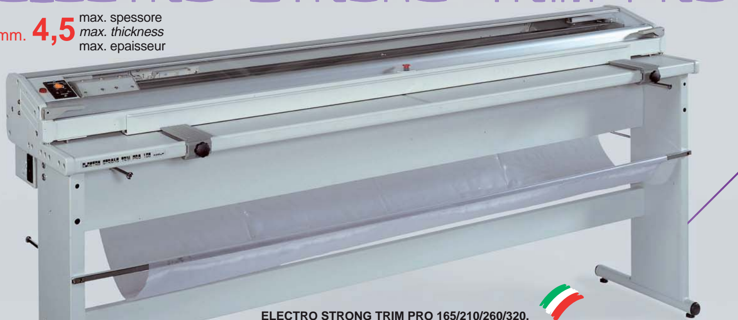
ELECTRO STRONG TRIM PRO 165/210/260/320.

mm. 4,5 max. spessore max. thickness max. épaisseur