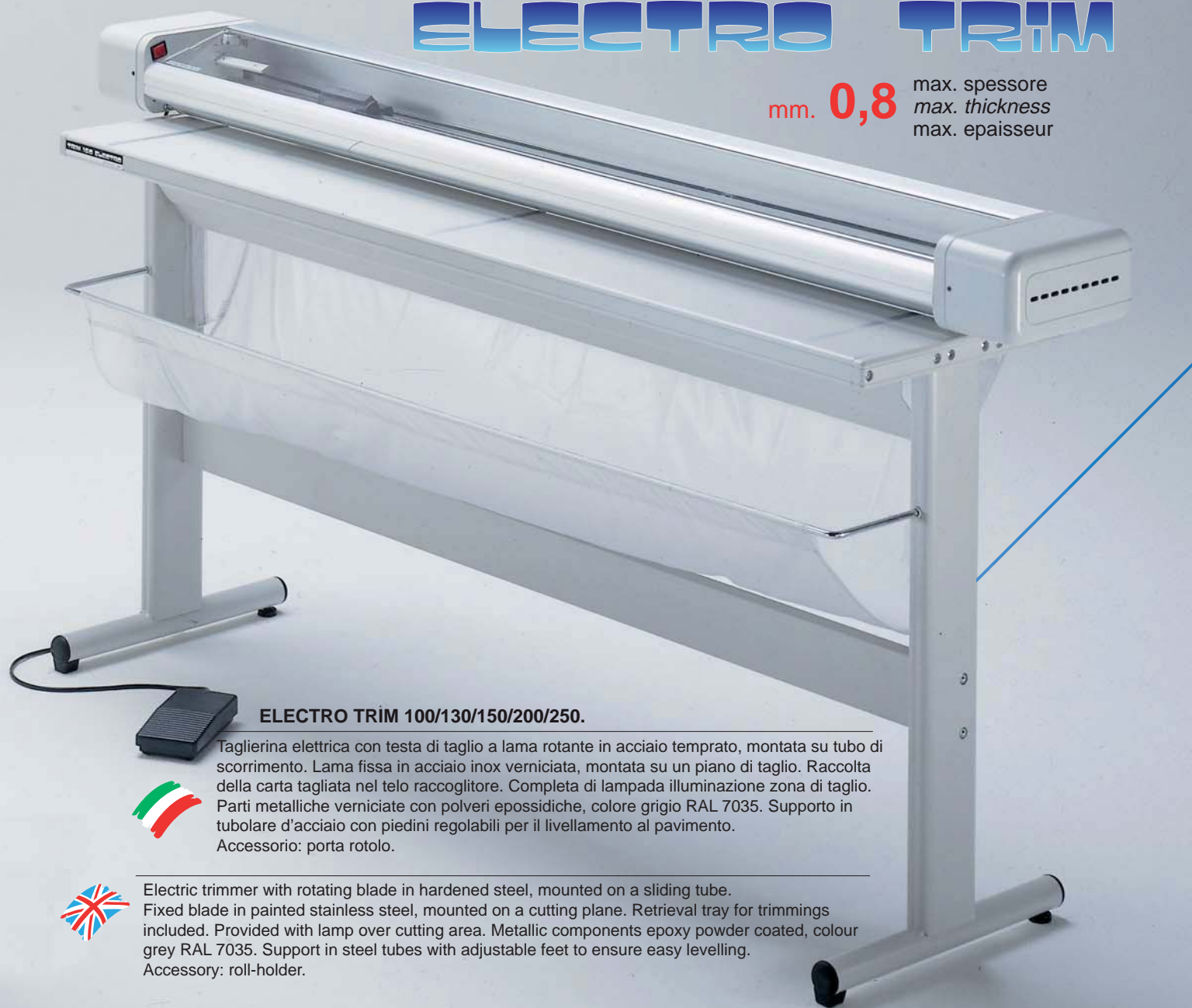
ELECTRO TRIM 100/130/150/200/250.

mm. 0,8 max. spessore max. thickness max. épaisseur